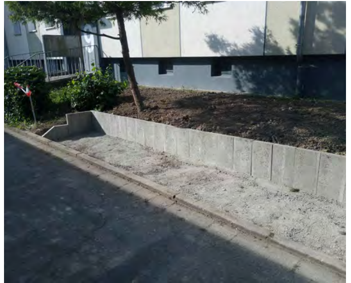
Alte Dorfstraße 7: Müllstandplatz und Fahrradplatz mit Anlehnbügel.